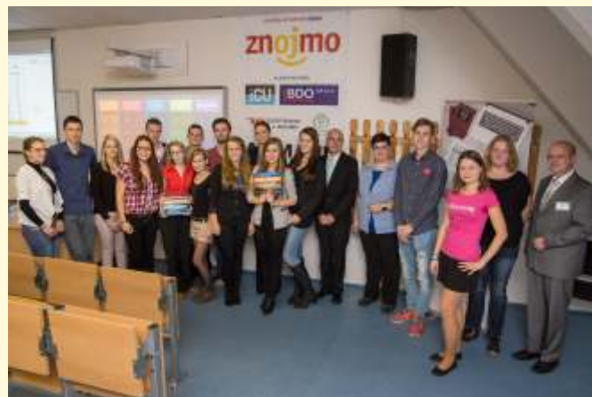
Vyherci sout že st edoškolák Da ový tým 2015

nejen p ednášela, ale zú astnila se také finálového kola celostátní sout že maturant „Da ový tým 2015“, která se konala v rámci