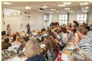
Zahájení Ú etní a da ové konference

Aby byly informace úplné, je t eba doplnit údaje o zam ení